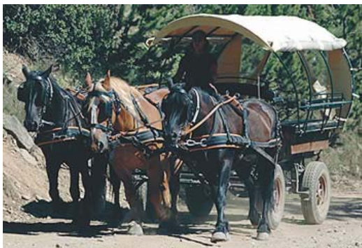
Mode de transport au mont Canigou

Sorties nature : randonnées avec accès pédestre et par traction animale (calèche) A voir : le torrent de la Llipodère (1685 m), la cabane Arago,