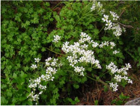
Saxifrage faux géranium